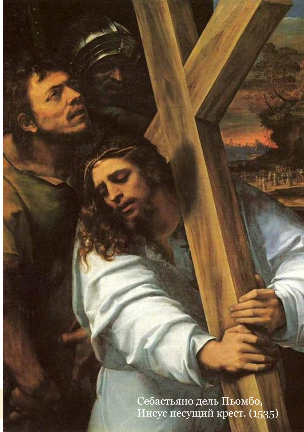
Себастьяно дель Пьомбо, Иисус несущий крест. (1535)

Из книги Яна ван Рэкенборга «Универсальный Гнозис»