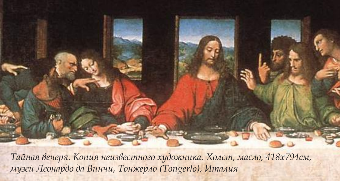
Тайная вечеря. Копия неизвестного художника. Холст, масло, 418x794см, музей Леонардо да Винчи, Тонжерло (Tongerlo), Италия