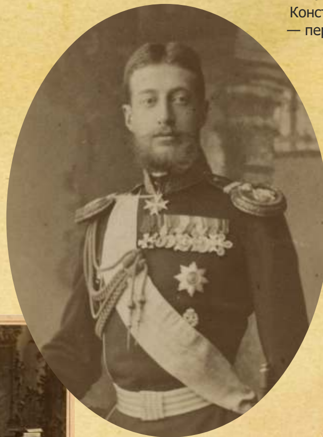
Великий князь Константин Константинович (1858-1915) — первый владелец картины Куинджи «Лунная ночь на Днестре».