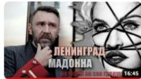
Мадонна и Шнуров: История на сон грядущий 2,5 тыс. просмотров • 1 месяц назад