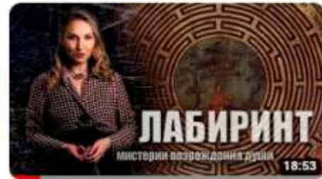
Лабиринт: Мистерии возрождения Души 2,9 тыс. просмотров • 3 месяца назад