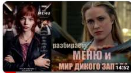
Что общего между фильмами "Меню" и сериалом "Мир дикого запада" 2,1 тыс. просмотров • 2 месяца назад