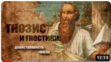
Гнозис и гностики: о двойственности. Числа 1,8 тыс. просмотров • 6 дней назад