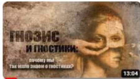
Гнозис и гностики: Почему мы так мало знаем о гностиках 5,4 тыс. просмотров • 1 месяц назад