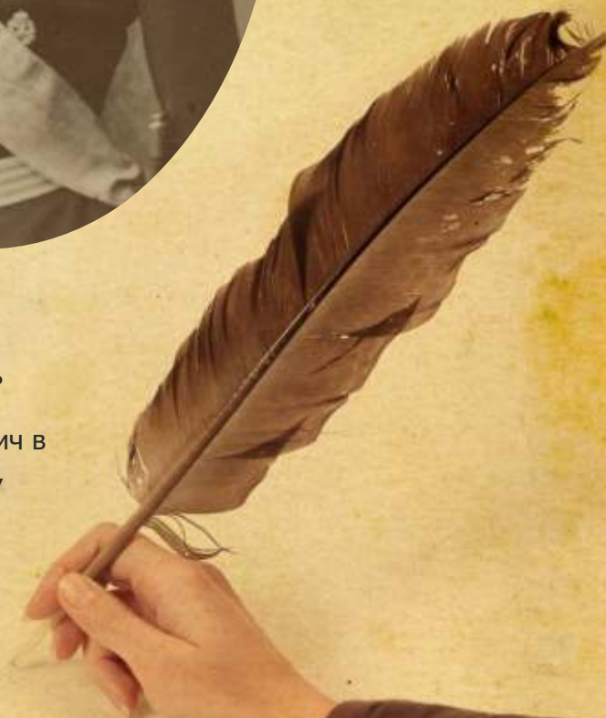
Великий князь Константин Константинович в роли Моцарта, 1880г.