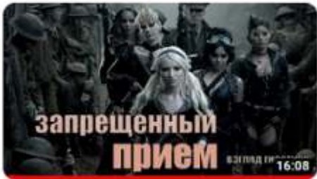
Запрещённый приём: взгляд гностика 3,7 тыс. просмотров • 2 месяца назад