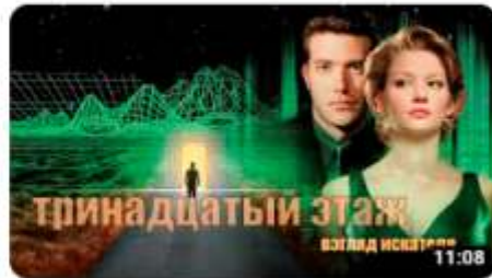
Тринадцатый этаж: взгляд искателя 1,8 тыс. просмотров • 3 месяца назад