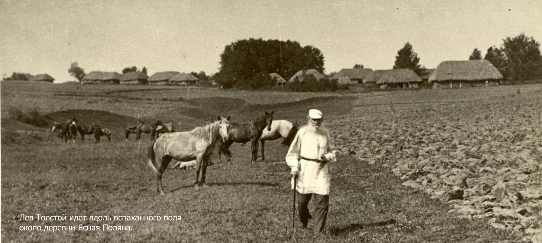
Лев Толстой идет вдоль вспаханного поля около деревни Ясная Поляна.