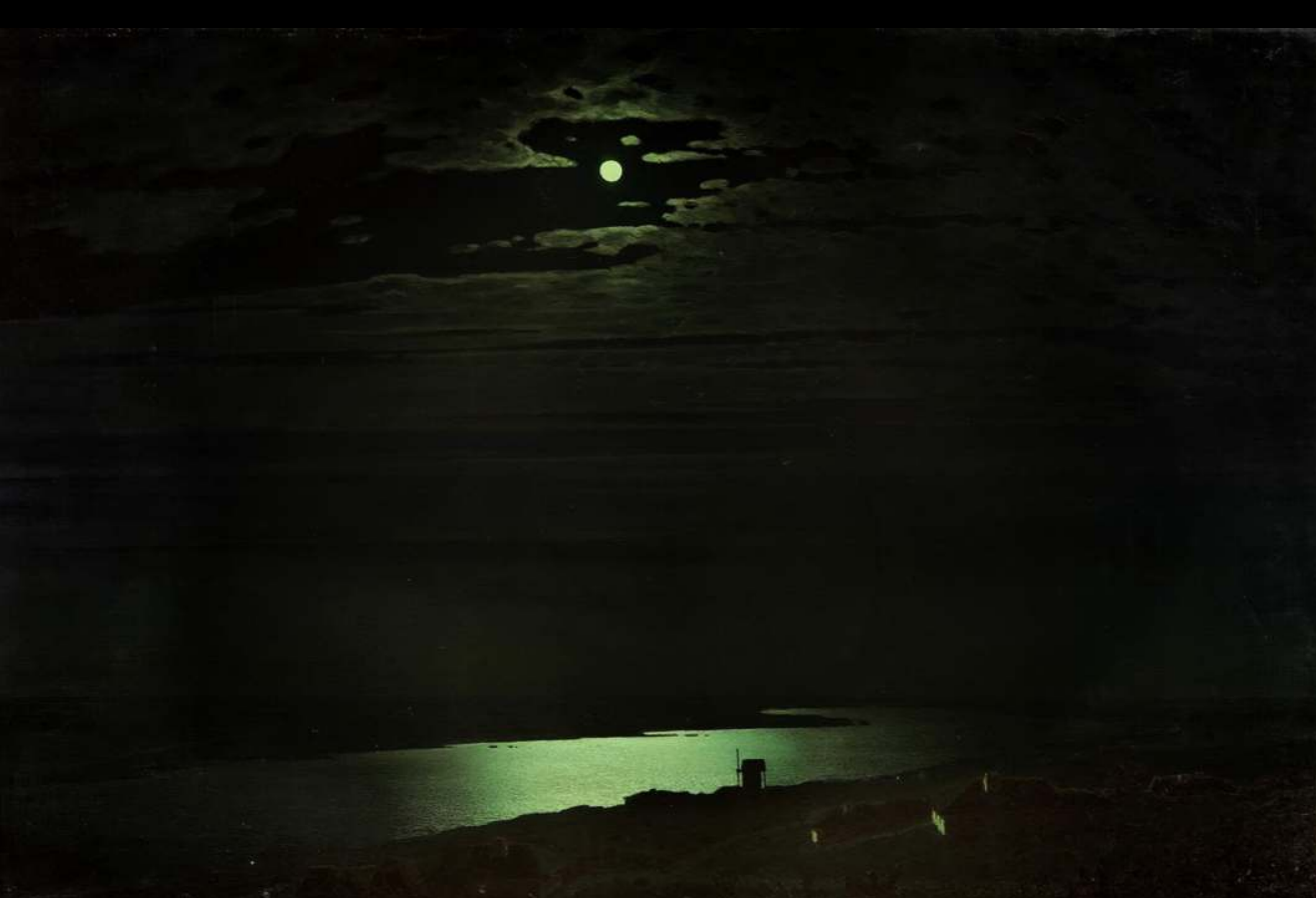
Архип Куинджи Лунная ночь на Днепре. 1880