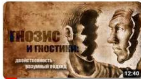
Гнозис и гностики: о двойственности. Разумный подход 2,3 тыс. просмотров • 3 недели назад