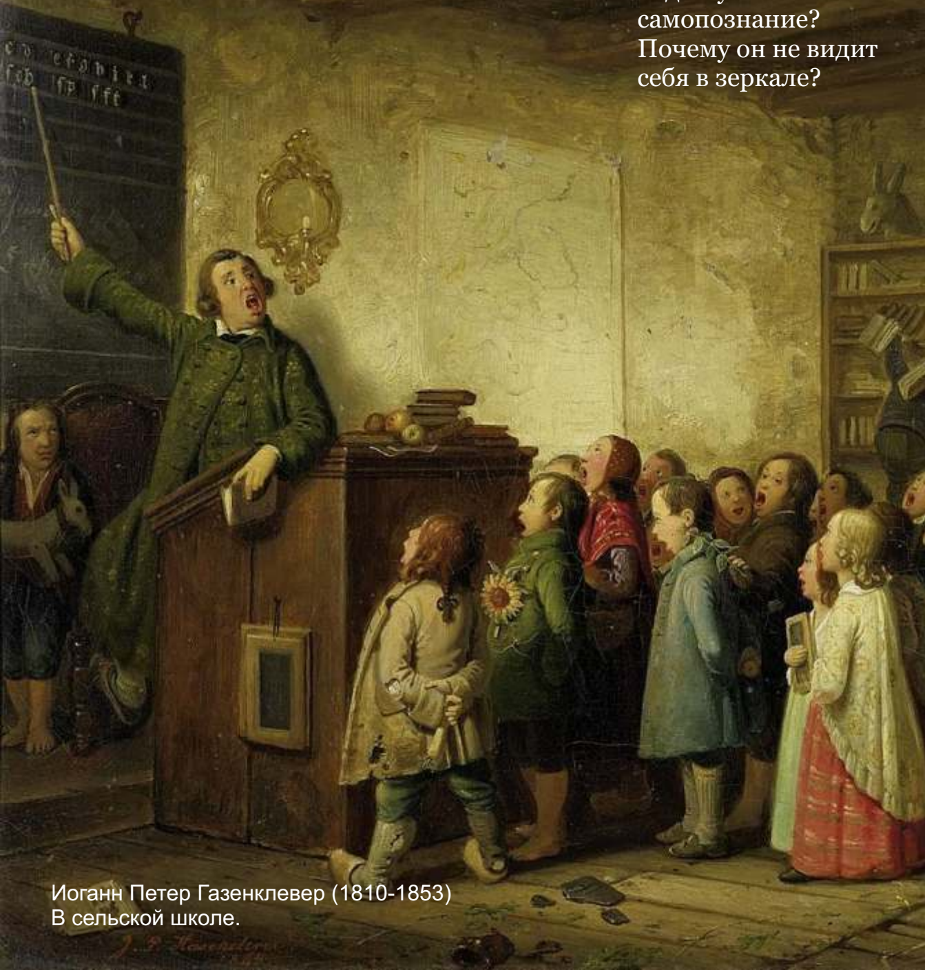
Иоганн Петер Газенклевер (1810-1853) В сельской школе.

Так отчего же ему недоступно самопознание? Почему он не видит себя в зеркале?