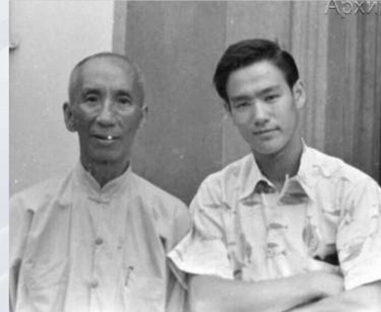
Брюс Ли со своим учителем Ип Маном, 1955 год

Тренируйся с теми, кто сильнее. Не сдавайся там, где сдаются другие. И победишь там, где победить нельзя.