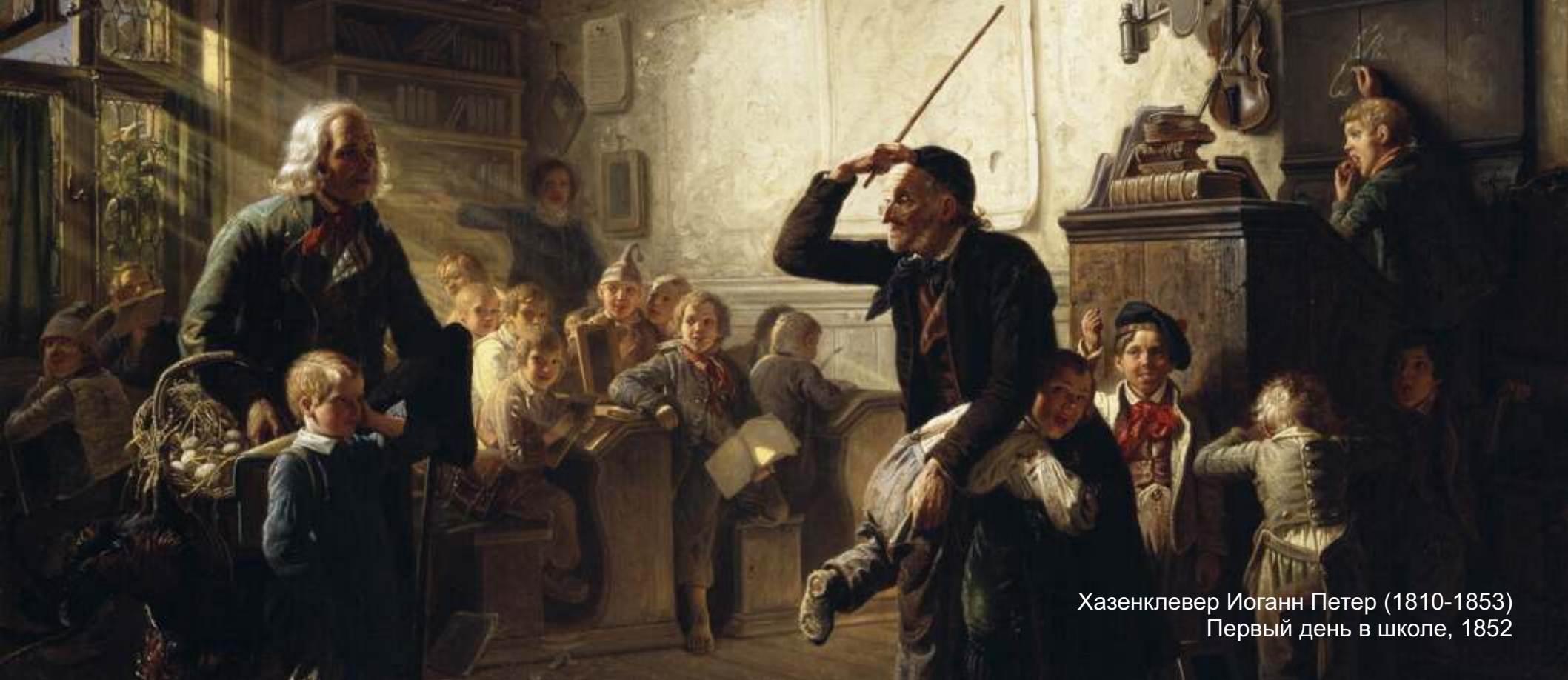
Хазенклевер Иоганн Петер (1810-1853) Первый день в школе, 1852