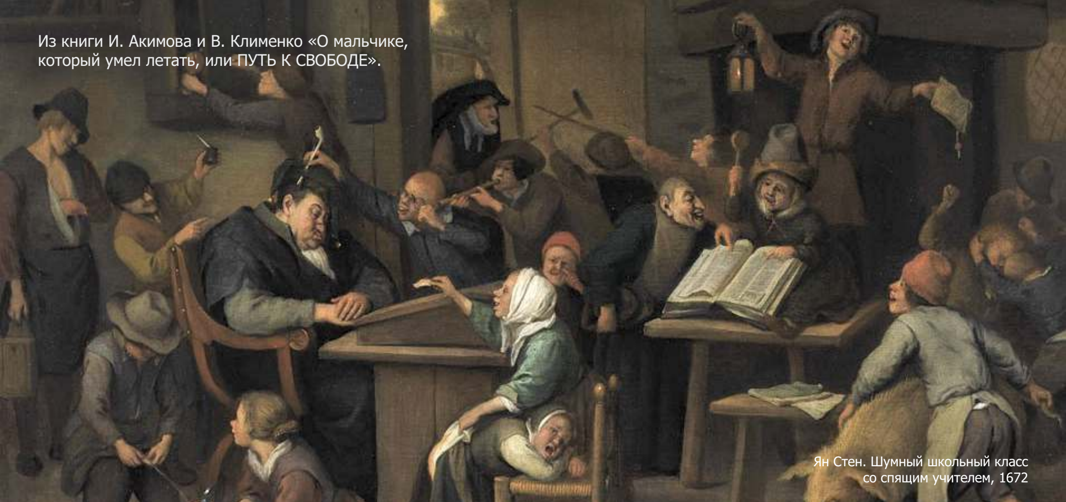
Ян Стен. Шумный школьный класс со спящим учителем, 1672