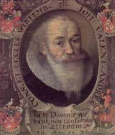
Johann Valentin Andreae (1586 - 1654) -